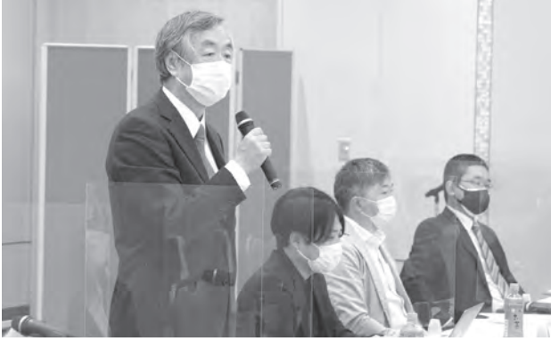
挨拶をする水上会長

審議後には、構成事業所各社の意見交換会が行われ、各社のデジタル化やDXに関する現状や今後当研究会に期待することなどについて、様々な意見が出ました。