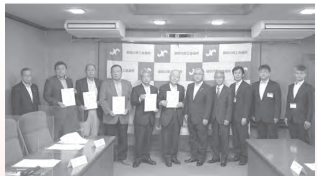
要請書受け取り後の集合写真

労働行政につきましては、日頃から格別の御理解と御協力を賜り、厚く御礼申し上げます。