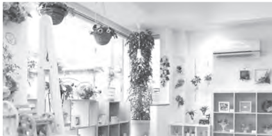
様々な作品がそろう店内