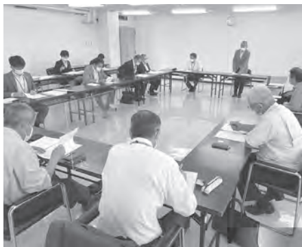
イベントの名称が決定した会議の様子

イベント当日は、市民交流センターtette西側の田舎通りを会場に、旅館料飲部会主催による「食の感謝祭」