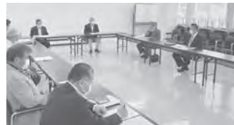
具体的な組織強化策について協議した委員会