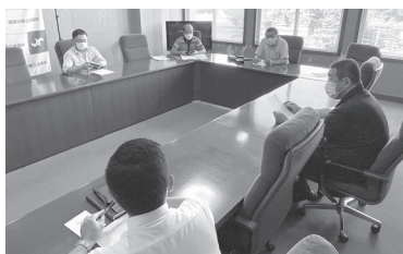
内容等の確認が行われた会議の様子

なお、今後の新型コロナウイルスの感染状況により中止となる場合もあります。当日出店する飲食店は次のとおりです。