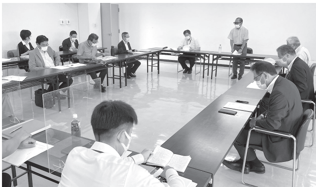
今後の広報活動等について協議した会議

tette通りでは、市内企業の物産や商品の展示、販売などがあり、絵のほりの絵付け体験、小物やフラワーアレンジメント等のワークショップも予定されています。