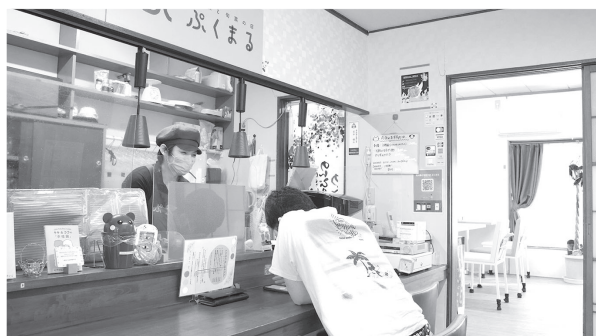
コミュニケーションがとりやすい店内