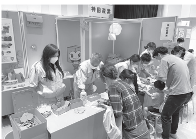
賑わいを見せる出店者ブース