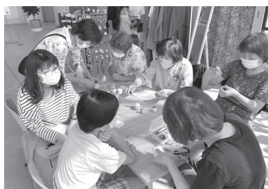
女性会によるワークショップ