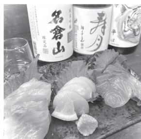
お刺身日本酒と一緒に