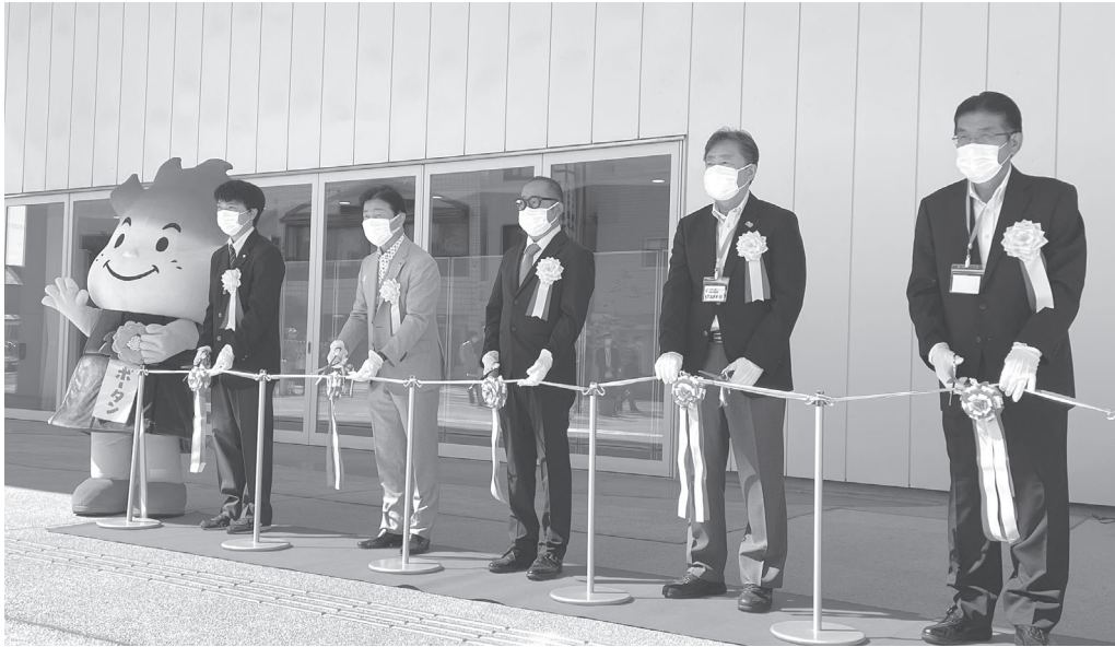
テープカットの様子

当日は、出展企業による商品の展示や販売に加え、実際に商品に触れていただいたり、各企業が趣向を凝らした工作体験やワークショップ等が行われ、各ブースとも賑わいを見せました。