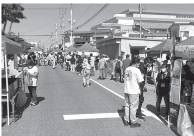
田善通りで行われた食の感謝祭