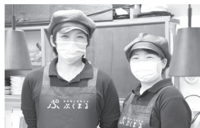
明るい笑顔で店を切り盛りする二人

お客様との会話やアンケートの実施を通して店内の環境やサービス内容の見直しを行うことで、家庭的な雰囲気の中でホッと一息つける環境作りに励んでおります。