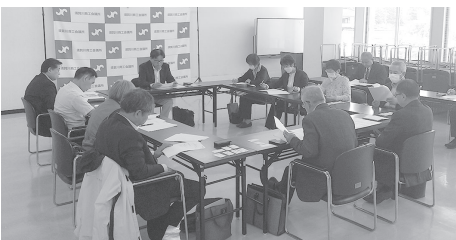
今年もアイデアを出しあい事業を展開していきます

その中で今年度は昨年度に引き続き、食の感謝祭を商工フェスタと同時開催することが決定した他、SDGsの取り組みとして「フードアクション10」の呼びかけを進めていくことが決定しました。