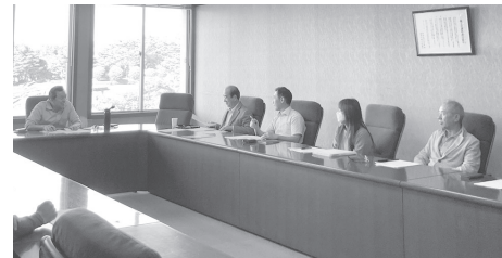
事業等について話し合われた会議

当日は令和5年度事業計画などについて協議されたほか、今年度、同部会が主管となる「会員親善(部会対抗)ゴルフコンペ」の開催についても協議され、9月に開催する方向で準備を進めることとなりました。