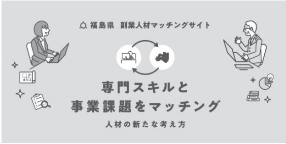
パラレルキャリア人材共創促進事業