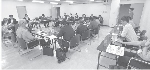
県の事業説明の様子

また、業務委託締結までの面談・契約書の作成サポートなどの丁寧なフォローアップを受けることができるため、コスト的にも労力的にも少ない負担で利用することができます。詳しくはこちらをご覧ください。