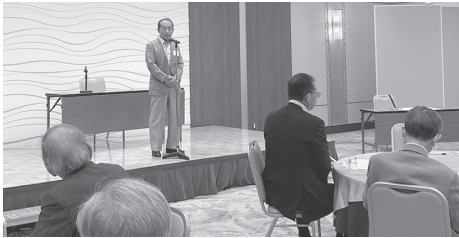
挨拶をする古寺会長

須賀川商店会連合会第66回通常総会が6月7日須賀川商工会館において開催され、令和4年度事業報告・収支決算、令和5年度事業計画・収支予算について原案通り承認されました。今年度の事業計画は、須賀川市釈迦堂川花火大会が4年ぶりに開催されることから同大会の露店出店、更には商店街にぎわい創出に向けた各種取り組み、消費喚起事業を積極的に行うことで決定しました。