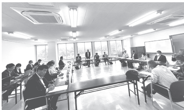
景観がよくなった会場で行われた常議員会

第609回常議員会が6月14日に開かれ、通常議員総会提出議案の令和4年度事業報告及び収支決算、役員の新選任について審議され、原案通り上程することが承認されました。