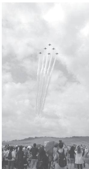
編隊飛行を披露するブルーインパルス

また、会場内では焼きそば や、かき氷などが販売され、 来場されたお客様は楽しい時 間を過ごしていました。