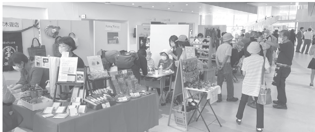
商工フェスタ昨年の様子