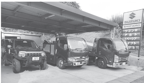
▲ロードサービスも対応しています