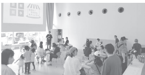
内容の説明を受ける参加者たち

あきんど祭り実行委員会(水落行男委員長)は、9月23日に市民交流センターにおいて「謎解き競争 in tette」を開催し、約50名が参加しました。tetteの各所に隠されたQRコードを読み込むことで、商店街に因んだクイズが出題され、これらを解くスピードを競い合うもので、10位までは景品が贈られるなどとても賑わいました。