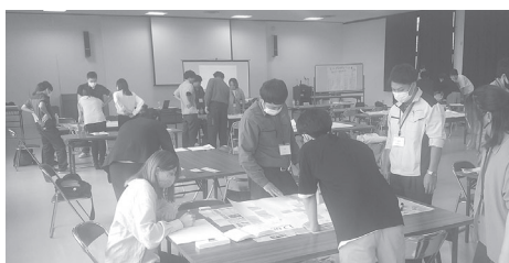
グループで課題に取り組んだ

当所並びに地区経営者協会主催による「若手・中堅社員研修会」が9月25日に須賀川市労働福祉会館において開催されました。