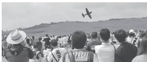
アクロバットを披露する室屋さん