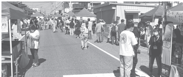
食の感謝祭昨年の様子

～車両や機械の購入、店舗改装などお考えの方へ～ (諸経費支払い資金などの運転資金にも)