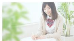
▶ 検定試験を受けたい