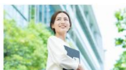
▶ 商工会議所に入会したい