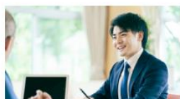
▶ 会員サービスを知りたい