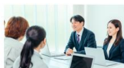
▶ 経営相談を受けたい