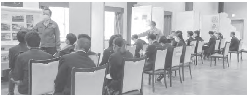
熱心に説明を聞く参加者の様子

当所では、今後も地元就職を希望する高校生や学生と企業との交流を促進する事業を積極的に推進していきます。