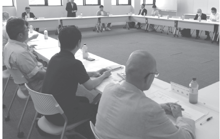
新たに組織された中心市街地活性化協議会

最後に、今後は新体制のもと各種まちづくり団体や関係機関とともに、新たな「まちづくりプラットフォーム」を構築し、メンバー同士の情報交友を図りながら、須賀川市や関係機関と連携し、まちなかの活性化につながる取組みを積極的に展開することを確認しました。