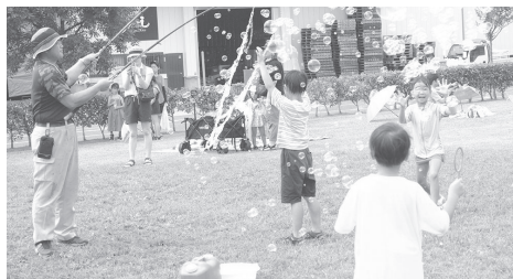
シャボン玉も大盛況