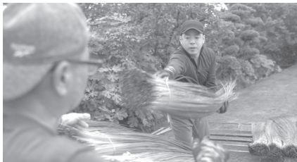
◀産地熊本で毎年い草収穫を手伝っています。

畳替えのご相談や、い草の香りをかいでリラックスがしたい時は是非お気軽にお立ち寄りください。