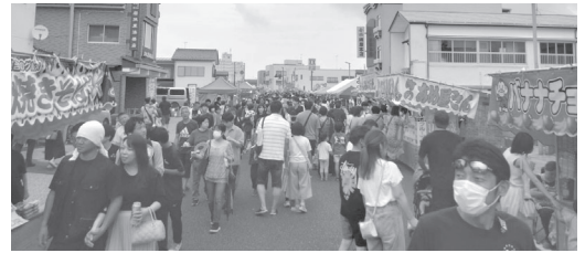
多くの人の来場がありました。