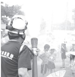
地元消防団員の協力のもと、豪雨級の雨を降らせました