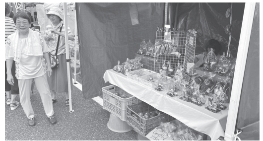
女性会もお手製の飾りと野菜を出品しました。