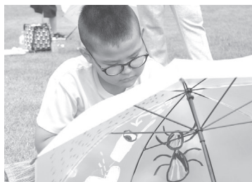
真剣な表情で自分の傘を作ります

疑似的に降らせた雨は警報級の豪雨を超えて滝のように。会場ではオリジナルの華やかな傘とともに濡れる参加者の歓声であふれていました。