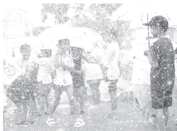
前が見えなくなるほどの水量です