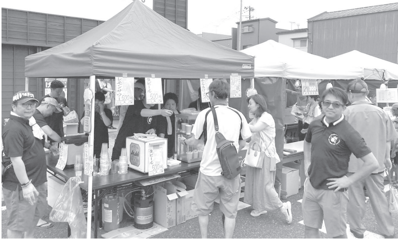
青年部のから揚げや飲み物は完売するほどの人気を見せました！