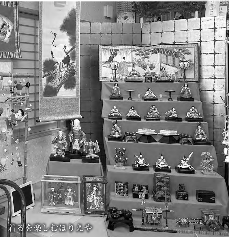
着るを楽しむほりえや