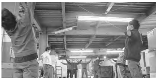
社員皆でラジオ体操▲

人手不足が進む社会で、従業員に長く働いてもらえる職場環境を作ろうとしたときに、会社として何ができるかを考えたのがきっかけです。現在は従業員の健康を第一に考え、挨拶時の健康チェックやラジオ体操を継続しています。特に口腔衛生を重視し、「健康は歯から!」を合言葉に、歯磨き指導や治療を推奨しており、社員が長く元気に働ける環境を目指し、健康経営を推進しています。