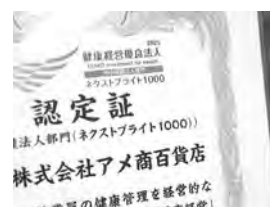
▲誇り高いネクストブライツ1000