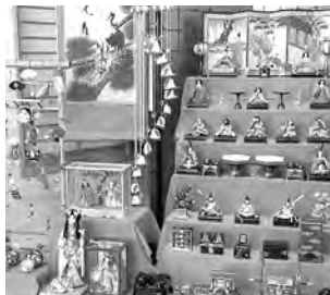
着るを楽しむほりえや