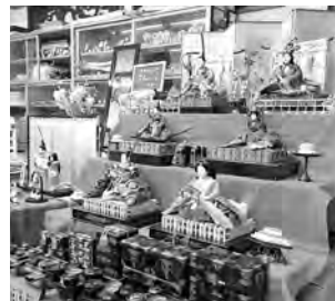
おしゃれ館よしかつ

3月3日まで開催された「第22回すかがわ商店街雛(ひな)の笑顔に会えるまち」であなたが選ぶお気に入りの展示店に、「レイマ美容室」、「着るを楽しむほりえや」、「おしゃれ館よしかつ」が展示優秀店に選ばれました!